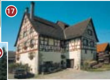
17 Die "Untere und Obere Mühle" in Ahausen - zwei sehenswerte Mühlen - 1457 erstmals erwähnt.