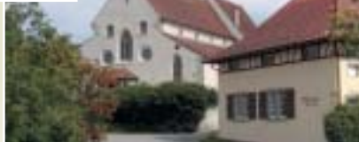
11 Pfarrkirche St. Georg - eine der ältesten Kirchen am nördlichen Bodenseeufer