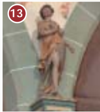
13 Standort der früheren Leonhardskapelle. Die Skulptur des Heiligen befindet sich in der Pfarrkirche St. Georg