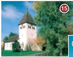
15 Kapelle St. Jakob in Ahausen - Madonnenplastik aus dem 15. Jahrhundert