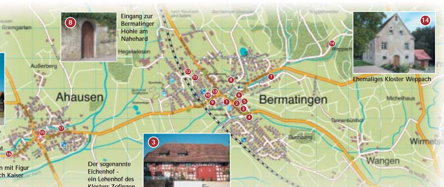
Ehemaliges Kloster Weppach