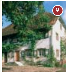
9 Kehlhof - März/April 1525 Quartier des Bauernführers Eitelhans Ziegmüller