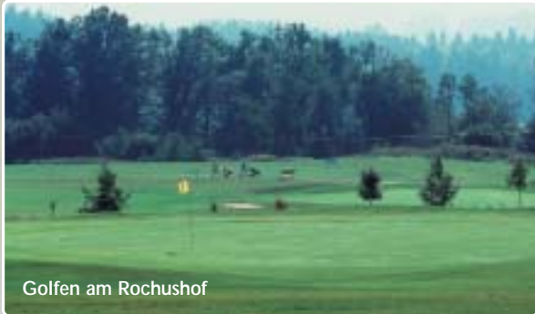
Golfen am Rochushof

Das Deggenhausertal ist ein familienfreundlicher Erholungsort. Abseits der Trampelpfade finden hier Natur- und Sportfreunde ebenso ihr Vergnügen wie Liebhaber eines erholsamen Urlaubs am Bodensee mit seinen attraktiven Ausflugszielen.