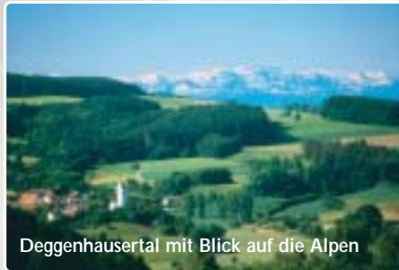
Deggenhausertal mit Blick auf die Alpen