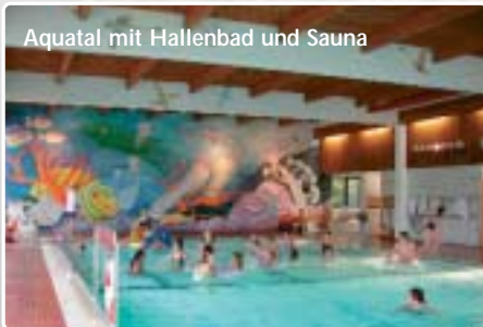
Aquatal mit Hallenbad und Sauna