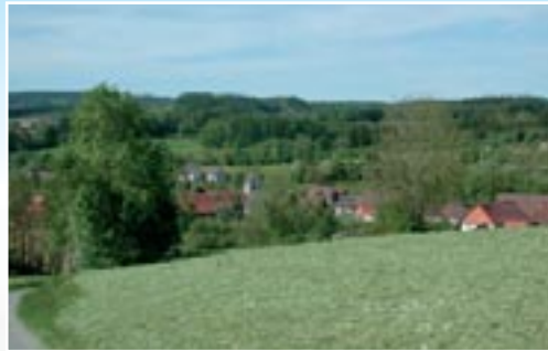
Blick auf Urnau während der Heuernte.