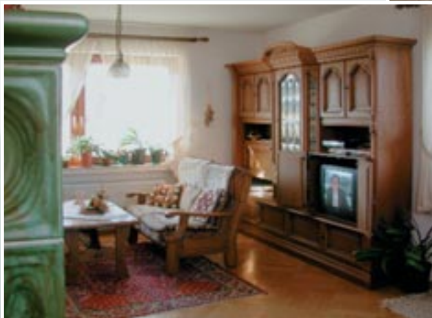
Das gemütliche Wohnzimmer mit SAT-TV – wenn man mal Lust zum Faulenzen hat.