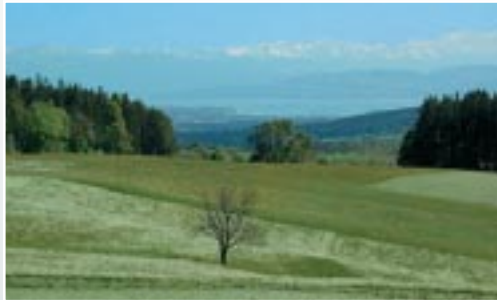
Blick vom "Höchsten" (833 m ü.M.): Im Vordergrund das Deggenhausertal im Hintergrund Bodensee und Alpen.