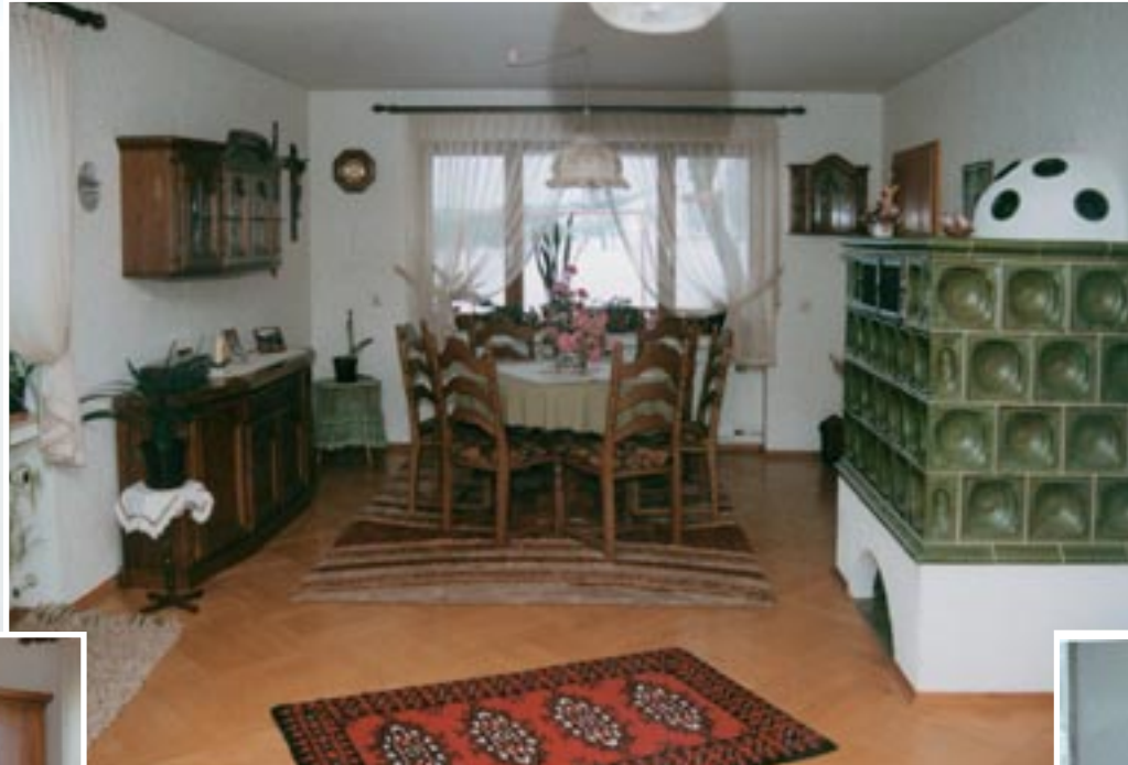
Essecke mit großem Tisch für viele hungrige Urlauber.