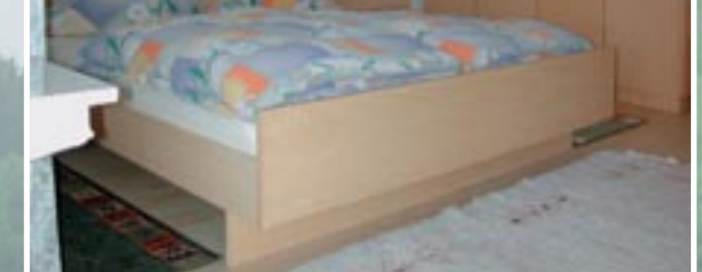
Unser neu gestaltetes Doppelschlafzimmer.