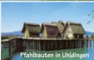
Pfahlbauten in Uhldingen